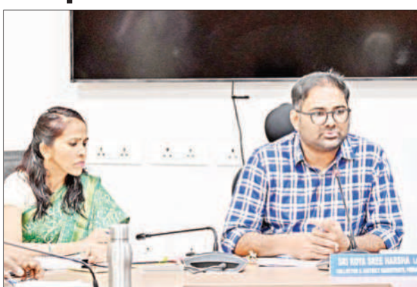
- జిల్లా కలెక్టర్ కోయ శ్రీ హర్ష